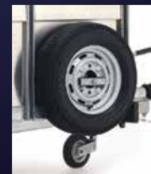
Roue de secours & support