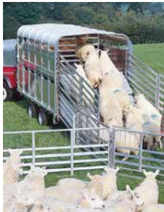
Chargement de l'étage supérieur.