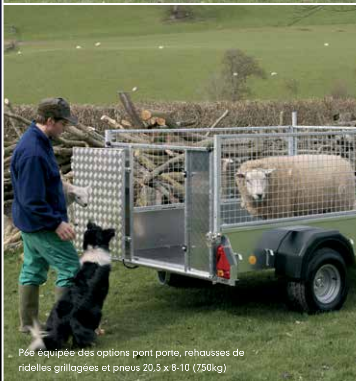
P6e équipée des options pont porte, rehausses de ridelles grillagées et pneus 20,5 x 8-10 (750kg)