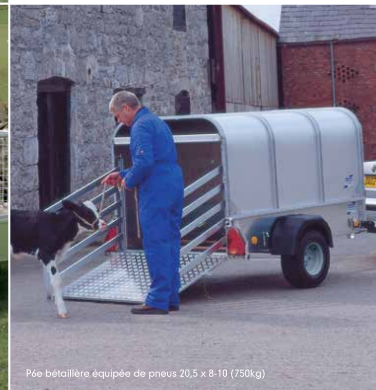
P6e bétailière équipée de pneus 20,5 x 8-10 (750kg)

* 500 kg, sinon 750 kg Dimensions en mètres