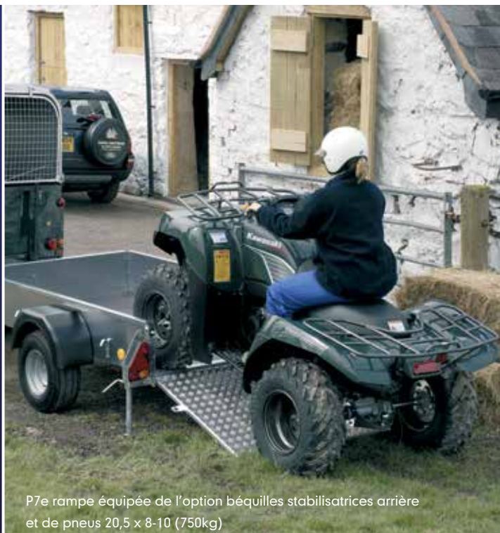
P7e rampe équipée de l'option béquilles stabilisatrices arrière et de pneus 20,5 x 8-10 (750kg)

Il existe d'autres versions de P6e et P7e. La gamme complète des P5, P6e, P7e et P8e est présentée dans notre brochure «Remorques non freinées», disponible auprès de votre concessionnaire Ifor Williams.