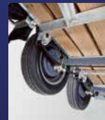
Essieu à poutre