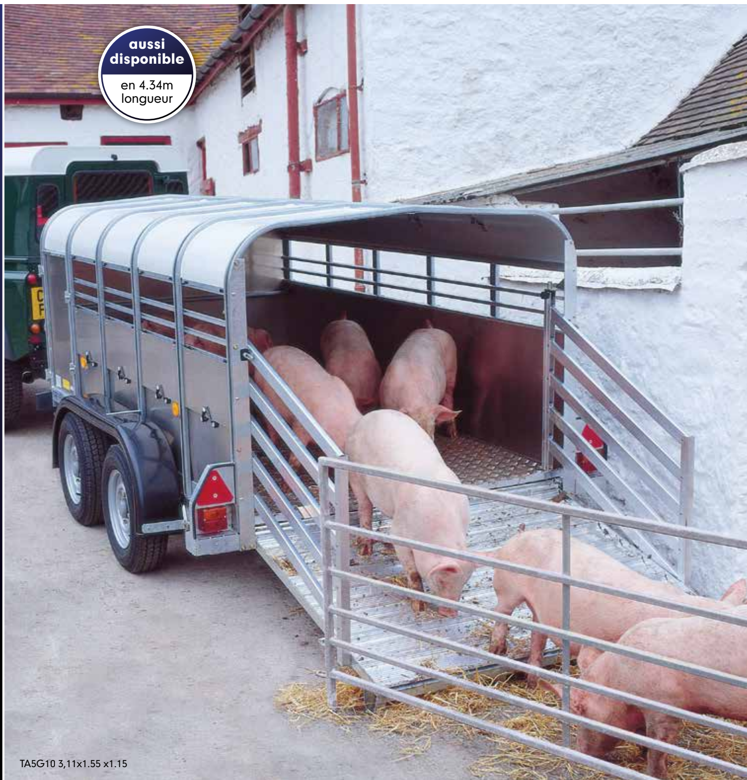
TA5G10 3,11x1.55 x1.15

Disponibles en 2,50 m, 3,11 m, 3,73 m et 4,34 m de longueur intérieure, les modèles TA5G 4' (1,15m de hauteur intérieure) comprennent également les caractéristiques standard suivantes :