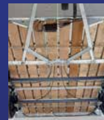
Châssis et plancher

C'est le souci du détail qui fait le succès des remorques Ifor Williams auprès de leurs propriétaires. Regardez plutôt nos équipements de série: