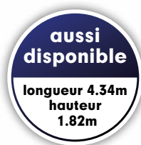
TA510 TA510G14 Triple essieu - 4.34x1.78x1.82 avec rail de protection pour ventilations inférieures