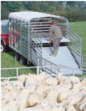
Pont EasyLoad™ déployé et barrière arrière baissée.

Barrière arrière fermée et pont EasyLoad™ en position basse. DP120-12 avec séparations transversales basses en option.