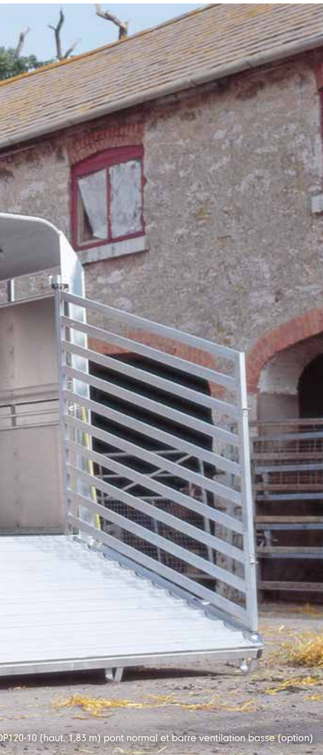
DP120-10 (haut. 1,83 m) pont normal et barre ventilation basse (option)