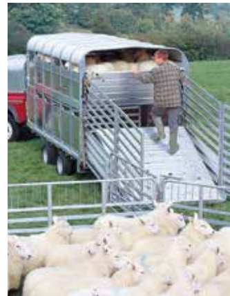
Barrière arrière fermée.