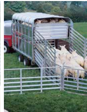
Le pont EasyLoad™ a été abaissé pour charger l'étage inférieur.